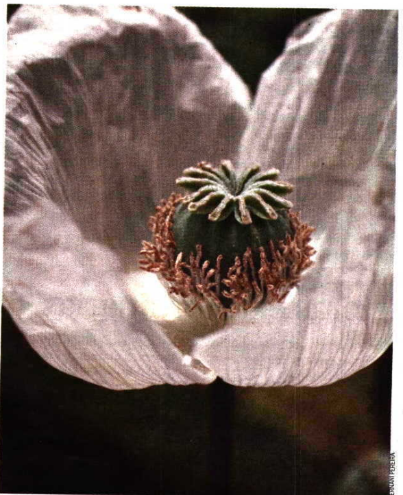
'Alvará' da ONU para a cultura do ópio baseia-se na tradição local